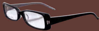
smooch 738 フレーム + レンズ 7800円 (単焦点1.50レンズ付き)

いつもご愛顧いただきありがとうございます。 この度、日頃の感謝の気持ちを込めまして 通常お値下げしない有名ブランドフレームや国産レンズなどを 特別価格にてご提供させていただきます。 年に一度、この機会にご来店を心よりお待ちしております。