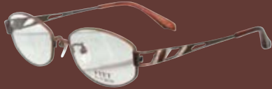
FITT FT15 フレーム + レンズ 14800円 (単焦点超薄型レンズ加算なし)