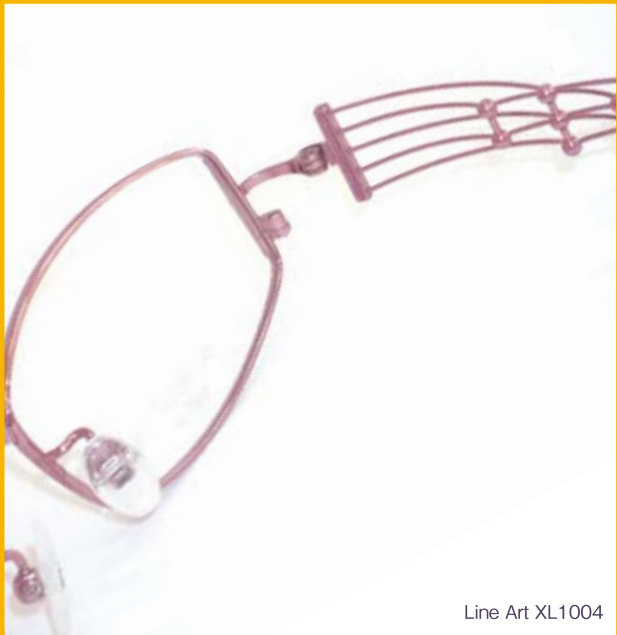
Line Art XL1004